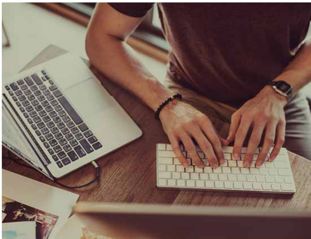
↑ Vyhradit si svůj pracovní prostor je jednou z klíčových podmínek efektivní práce z domova.