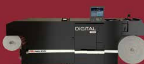
DIGITAL PRO 1