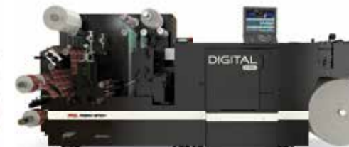
DIGITAL PRO 3