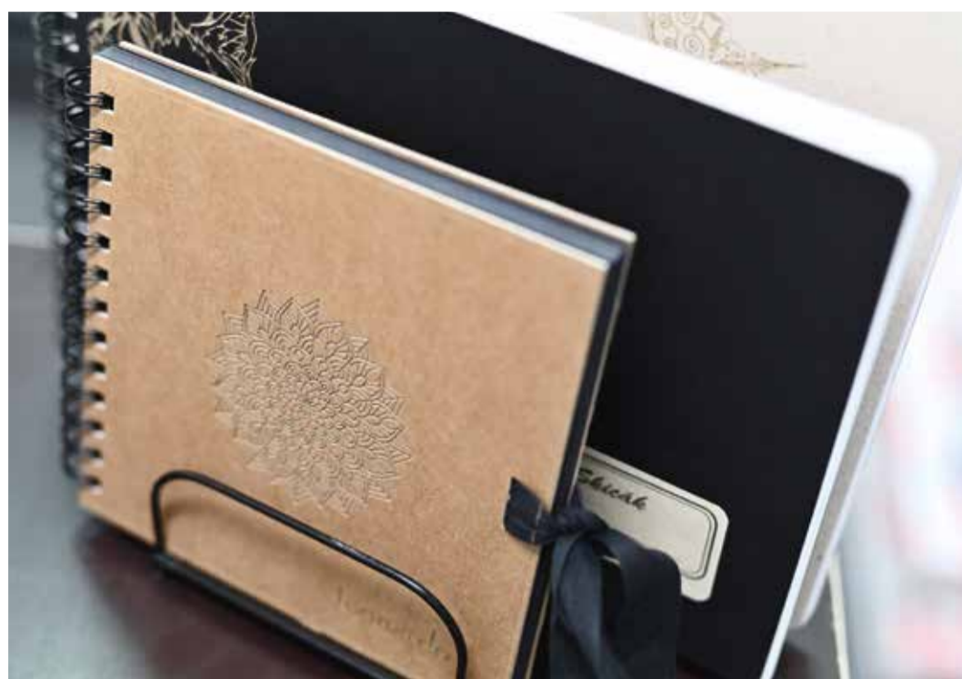
↑ Produkty z blokařství BOBO zušlechťené pomocí laserového výseku.

Tradiční tiskovina se hodně proměnila. Lidé jsou nároční a současně chtějí být též originální. Ke slovu se tak dostává digitální technologie s velkým důrazem na personalizaci. Kromě personalizace se v BOBO odlišili od konkurence využitím laseru coby mobilní platformy. Pravidelně pořádají „roadshow“, kdy jezdí po různých akcích, ale i přímo k zákazníkům a laser vozí s sebou. Navštěvují hodné veletrhy, což je prý stále ta nejlepší možnost, jak se prezentovat. Jejich produkty lákají v podstatě všechny generace, od těch školou povinných až po seniory. Mohou tak demonstrovat možnosti laserového výseku (a své produkty) přímo u zákazníka a to je věc, na níž klienti stále velmi dobře slyší. Spolu s novými službami se zaměřují také na novou klientelu, což je teď B2B segment. V této oblasti chtějí nabízet kalendáře, diáře a bloky formou