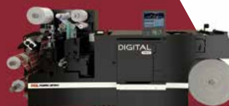
DIGITAL PRO 2